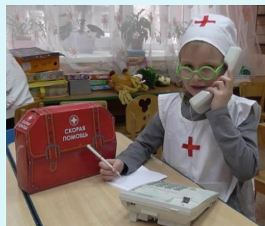
Игра постановка "Вызов скорой помощи".