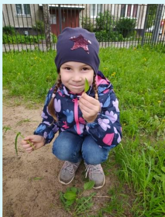
А вот и подорожник