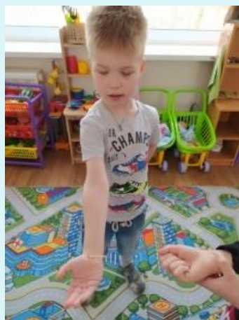
Как работает сердце