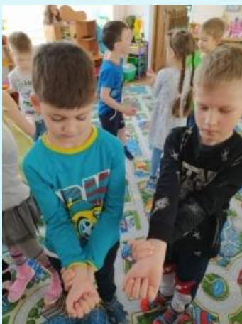
Где спрятался пульс

Во время проведения игр–экспериментов дети изучали свой организм, узнавали новые факты. Например, для того чтобы обозначить воздух, вдыхаемый человеком надо дуть через соломинку на воду в стакане. Увиденные пузырьки наглядно показывают, как происходит процесс вдоха-выдоха.