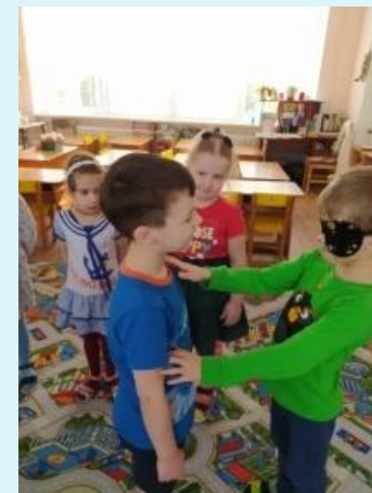
Если не видишь